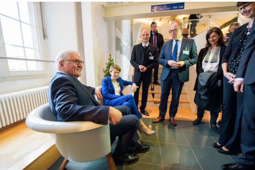
Wanne-Wonnen: Bundespräsident Steinmeier nahm bei Villeroy & Boch im Badewannen-Sessel Platz

Protokoll hin oder her: Unser Staatsoberhaupt Frank-Walter Steinmeier gab sich bei seinem ersten Saarland-Besuch betont locker, freundlich und volksnah