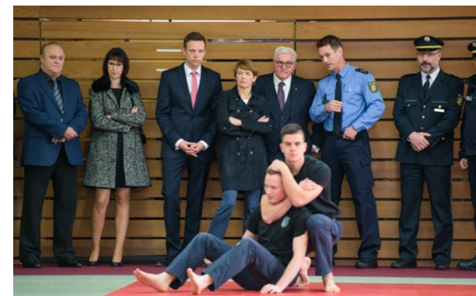
Im Schwitzkasten: Kampfsport-Training bei der Polizei