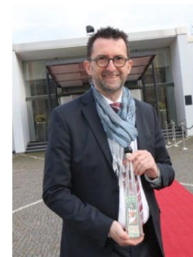
Hoch-Prozentiges für den hohen Gast: Umweltminister Reinhold Jost überbrachte dem Bundespräsidenten eine Flasche „Hundsärsch“-Schnaps aus seiner Heimat