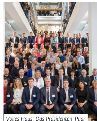
Volles Haus: Das Präsidenten-Paar bei Villeroy & Boch in Mettlach

R ote Teppiche. Schwere Staats-Karossen. Motorrad-Staffeln. Security-Leute mit Knopf im Ohr. Ja, wenn der erste Mann des Staates das Saarland besucht, herrscht allenthalben „Großer Bahnhof“. Umso erfreulicher, dass sich Bundespräsident Frank-Walter Steinmeier (62) und seine Ehefrau Elke Büdenbender (56) bei ihrem zweitägigen Termin-Marathon entspannt, umgänglich und volksnah gaben. TOP zeigt die die schönsten Impressionen zwischen Selfies, Smalltalk und Stadt-Spaziergang. ■