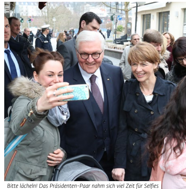
Bitte lächeln! Das Präsidenten-Paar nahm sich viel Zeit für Selfies