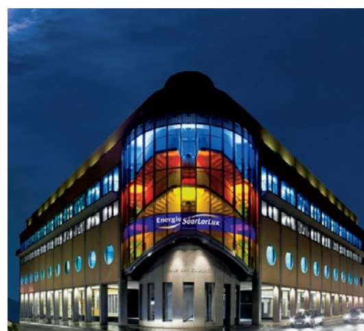
Hauptsitz der Energie SaarLorLux: Das „Haus der Zukunft“ in der Saarbrücker Innenstadt