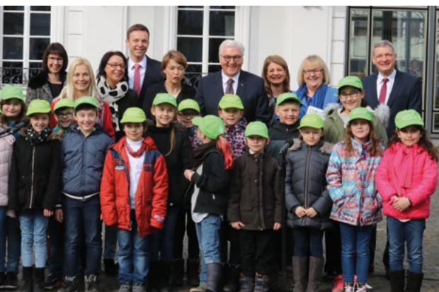
Schüler der Grundschule Gisingen sangen ein Begrüßungs-Ständchen