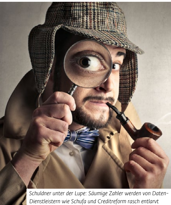
Schuldner unter der Lupe: Säumige Zahler werden von Daten-Dienstleistern wie Schufa und Creditreform rasch entlarvt