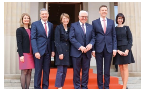
Das Präsidenten-Paar auf den Stufen des Landtags: Links Landtags-Präsident Stephan Toscani mit Ehefrau Cécile, rechts Ministerpräsident Tobias Hans mit Ehefrau Tanja