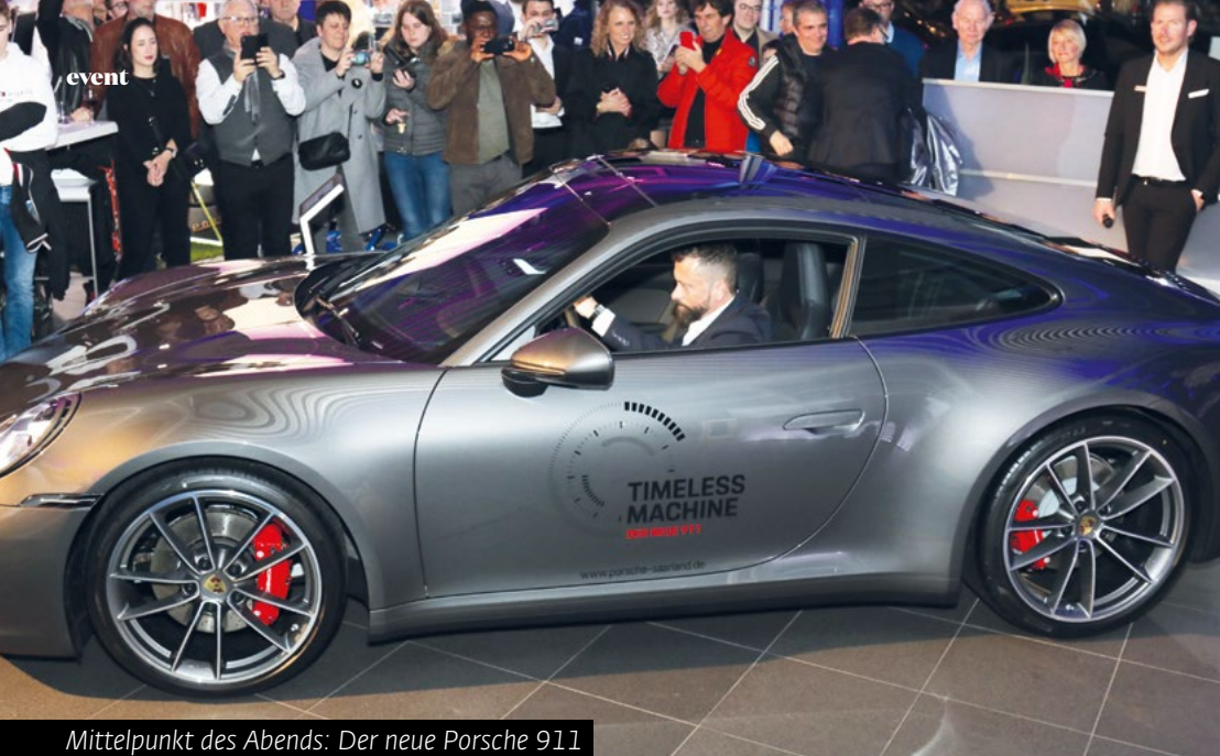
Mittelpunkt des Abends: Der neue Porsche 911