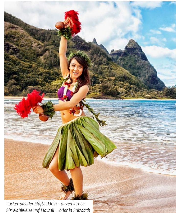
Locker aus der Hüfte: Hula-Tanzen lernen Sie wahlweise auf Hawaii – oder in Sulzbach