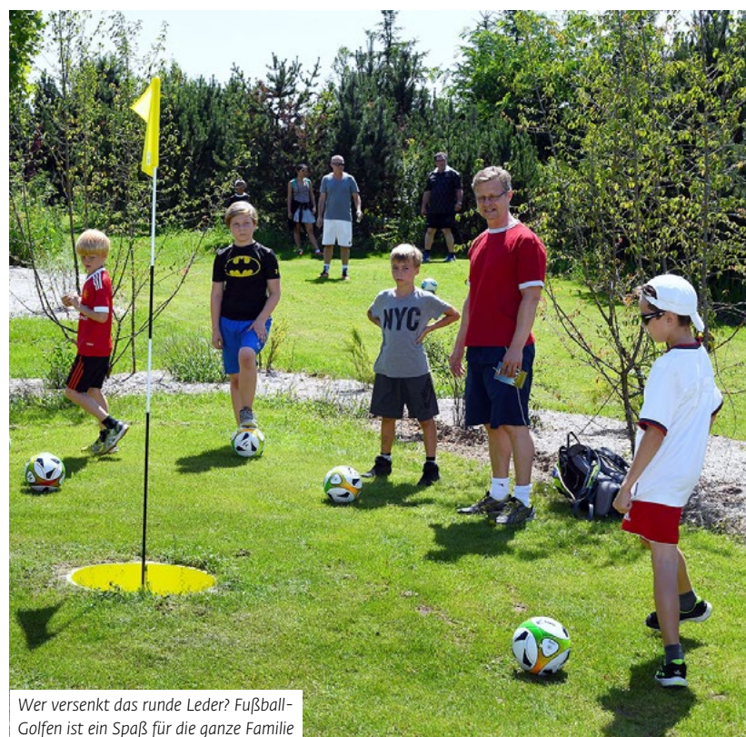
Wer versenkt das runde Leder? Fußball-Golfen ist ein Spaß für die ganze Familie

Infos unter www.fuballgolfsaar.de , www.golfsaar.de sowie www.fussballgolf-bostalsee.de .