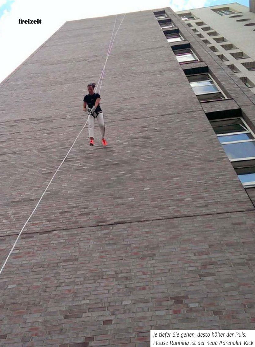
Je tiefer Sie gehen, desto höher der Puls: House Running ist der neue Adrenalin-Kick