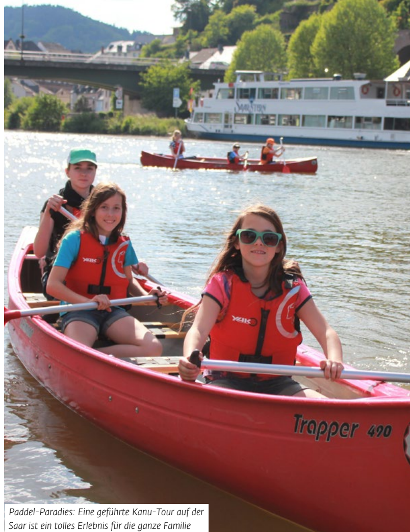
Paddel-Paradies: Eine geführte Kanu-Tour auf der Saar ist ein tolles Erlebnis für die ganze Familie

Anfänger buchen am besten eine Tour bei „Kanu SaarFari“ in Schoden (bei Trier). Für die 14 Kilometer lange Strecke von Merzig bis Mettlach brauchen Sie knapp 5 Stunden. Natürlich sind auch andere Routen buchbar. Beispielsweise eine Wasserfall-Tour bei Saarburg. ■