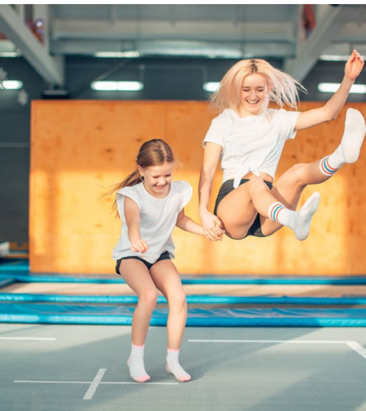
Lust auf Luftsprünge? In der „Jump Arena“ können Sie sich nach Herzenslust austoben