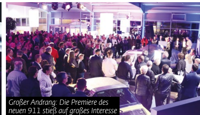
Großer Andrang: Die Premiere des neuen 911 stieß auf großes Interesse