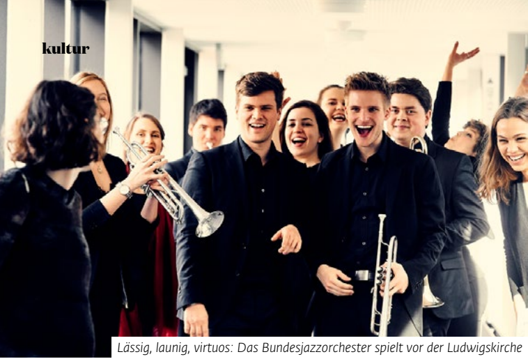
Lässig, launig, virtuos: Das Bundesjazzorchester spielt vor der Ludwigskirche