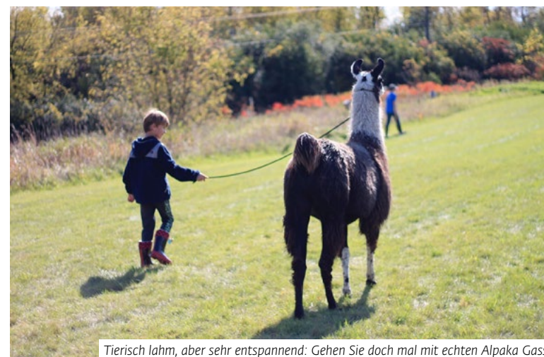
Tierisch lahm, aber sehr entspannend: Gehen Sie doch mal mit echten Alpaka Gassi