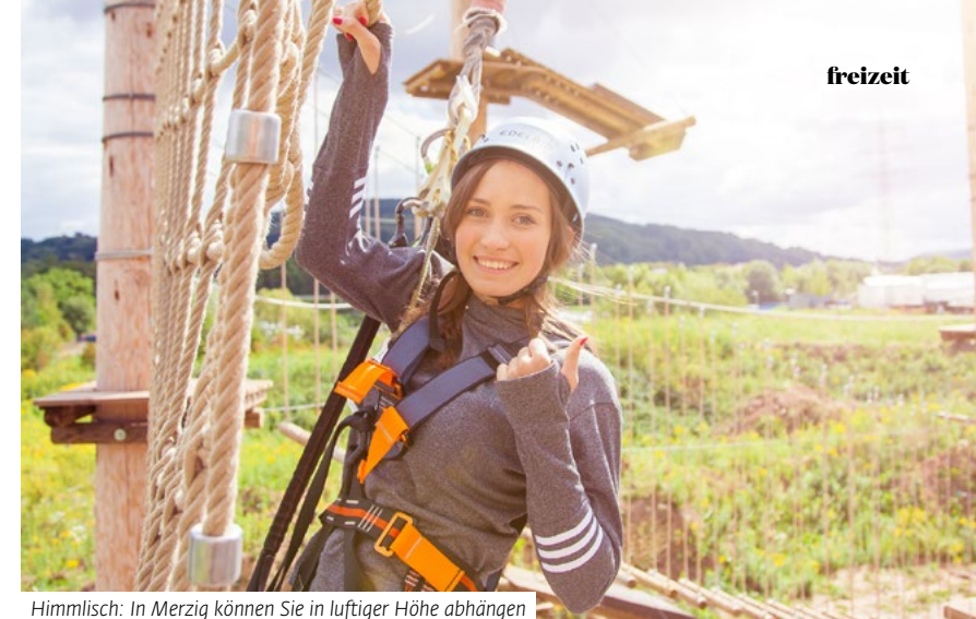
Himmlich: In Merzig können Sie in luftiger Höhe abhängen

Man muss nicht unbedingt in die Berge: Manchmal reicht auch ein Ausflug nach Merzig. Hier, in Europas größtem Kletterhafen wandeln Wagemutige über schmaler Holzbretter, Netze, Gitter und schwingende Balken – teilweise in 20 Metern Höhe! Der Abenteuerpark besteht aus 12 Parcours – von sehr leicht bis sehr schwer. Sechs „Flying Fox“ – Seilbahnen mit einer Länge von bis zu 44 Metern, einem Quick Jump und einen Base Jump. Rund 100 Übungen erwarten die Kletterer. Die Ausrüstung wird gestellt. ■ Infos: www.kletterhafen.de