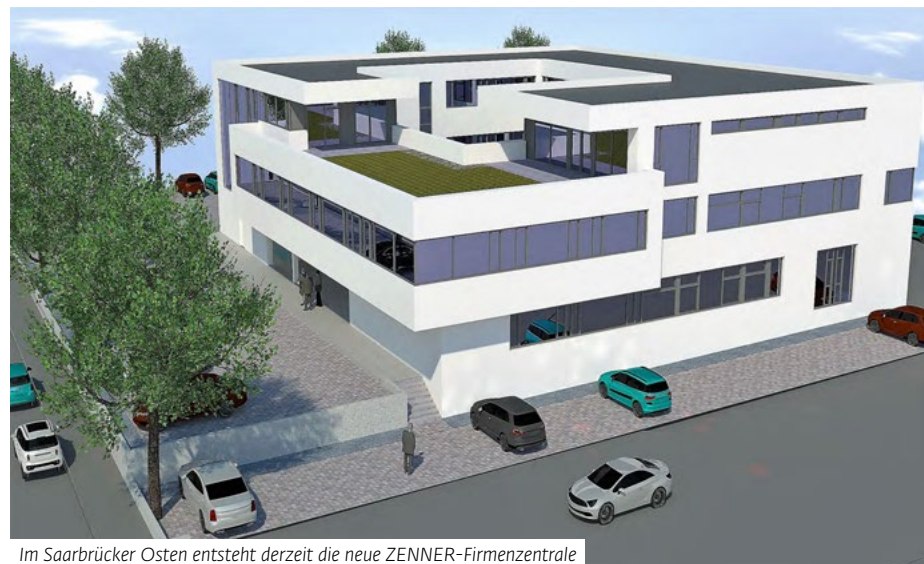
Im Saarbrücker Osten entsteht derzeit die neue ZENNER-Firmenzentrale