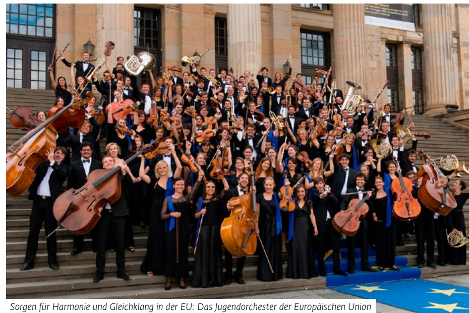
Sorgen für Harmonie und Gleichklang in der EU: Das Jugendorchester der Europäischen Union

lebt den europäischen Gedanken auf musikalische Weise – und ist weltweit unterwegs. In Saarbrücken spielen sie Sinfonien von Richard Strauss, Mozart und Bruckner. Zur Eröffnung der Musikfestspiele hat sich Kultur-Staatsministerin Prof. Monika Grütters angekündigt.