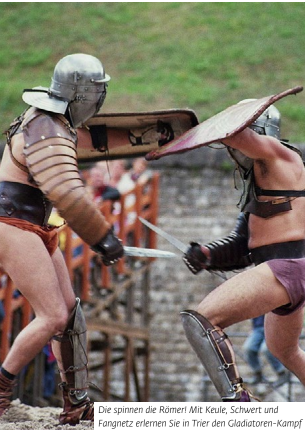
Die spinnen die Römer! Mit Keule, Schwert und Fangnetz erlernen Sie in Trier den Gladiatoren-Kampf