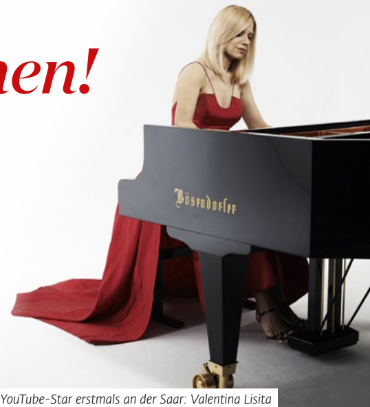
YouTube-Star erstmals an der Saar: Valentina Lisitsa

Youtube-Star Valentina Lisitsa Freitag, 3. Mai 2019, 19 Uhr Universität des Saarlandes