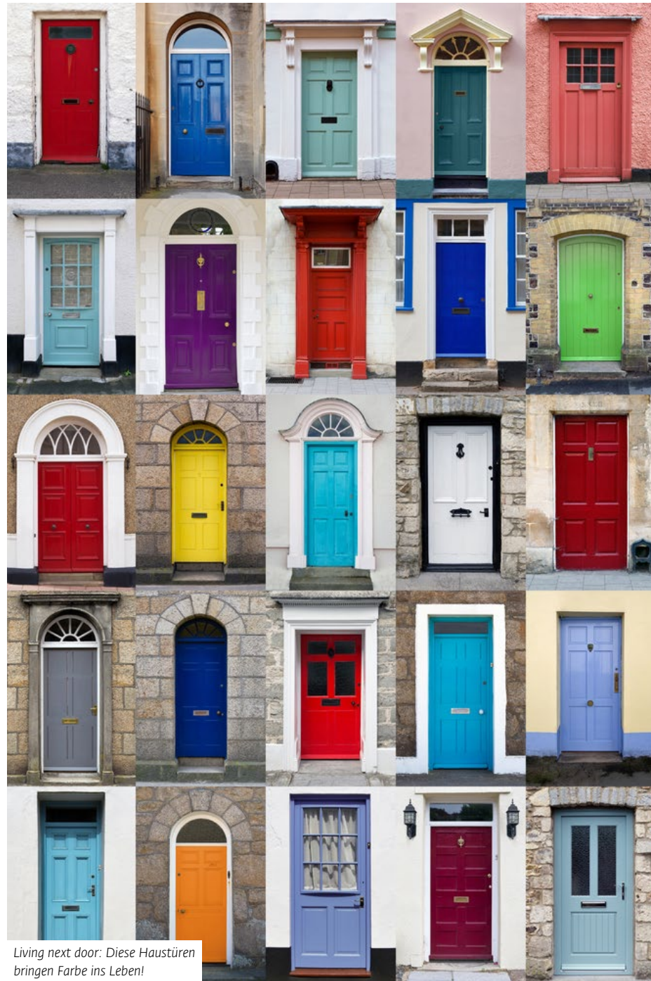
Living next door: Diese Haustüren bringen Farbe ins Leben!

lationssteuer. Wird das Wohneigentum allerdings selbst genutzt, dann kann es grundsätzlich steuerfrei verkauft werden.