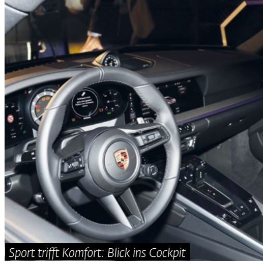
Sport trifft Komfort: Blick ins Cockpit