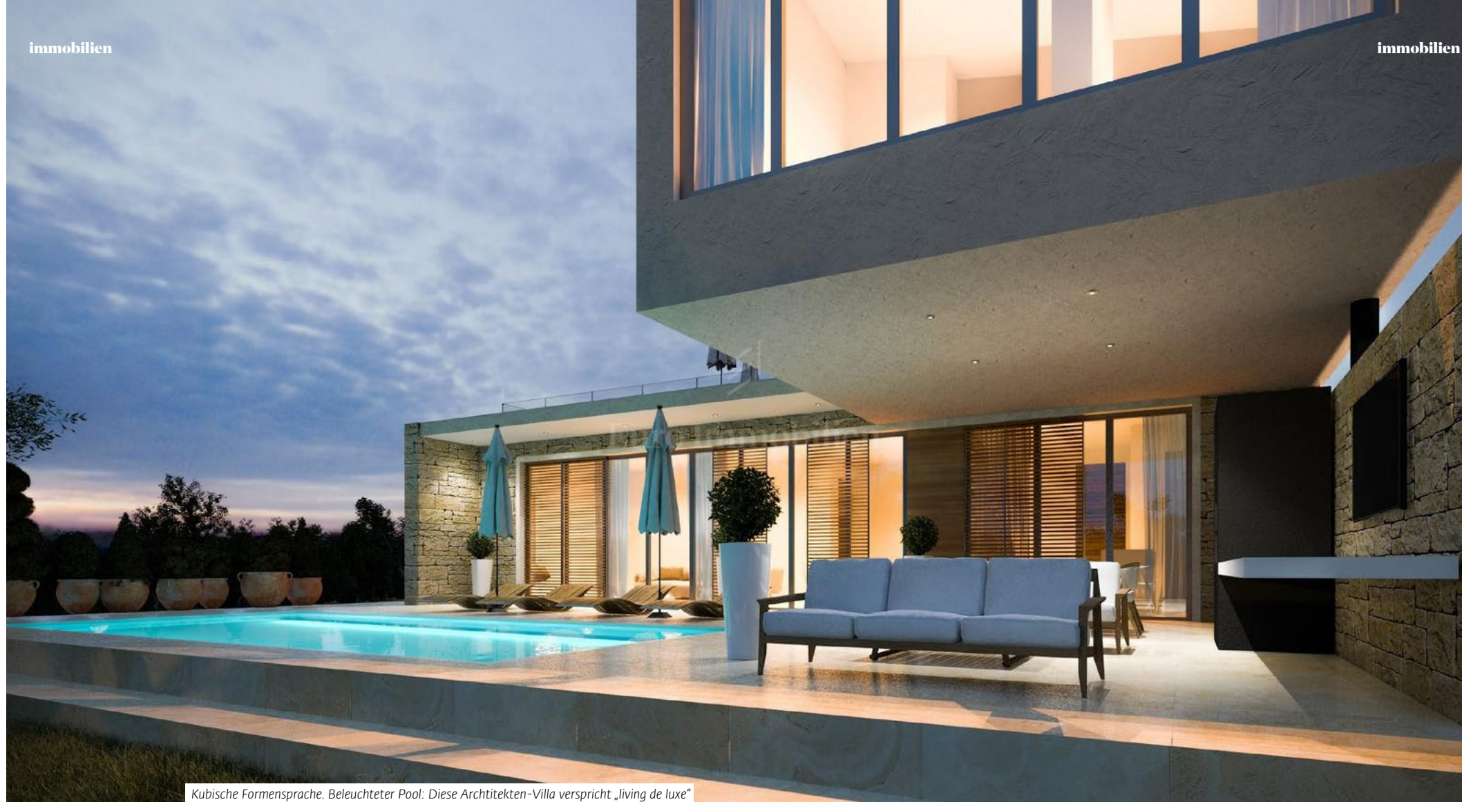
Kubische Formensprache. Beleuchteter Pool: Diese Architekten-Villa verspricht „living de luxe“